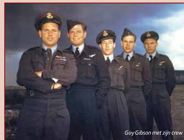
Guy Gibson met zijn crew

Op 19 september 1944 bestuurde Guy Gibson als masterbomber een tweemotorige bommenwerper van het 627 squadron met als navigator squadronleader James Warwick. Deze jachtbommenwerper (type De Havilland Mosquito) was een voor die tijd zeer geavanceerd type vliegtuig dat met hoge snelheden (bijna 700 km per uur) op lage hoogte kon vliegen. In dit tweepersoonsvliegtuig zat de piloot en de navigator naast elkaar. Op die bewuste septemberdag kwamen zij terug van een bombardement op Rheydt en Münchengladbach. Omstreeks 22.45 uur werd de jachtbommenwerper met een haperende motor gezien boven Steenbergen. Het werd veroorzaakt door een technisch defect waardoor het vliegtuig zonder brandstof kwam te zitten, waarna deze vlakbij een boerderij in de toenmalige West Graaf Hendrikpolder neerstortte en in brand vloog. De beide inzittenden werden nabij het wrakstuk gevonden en werden op het plaatselijke Rooms-Katholieke kerkhof van Steenbergen begraven.