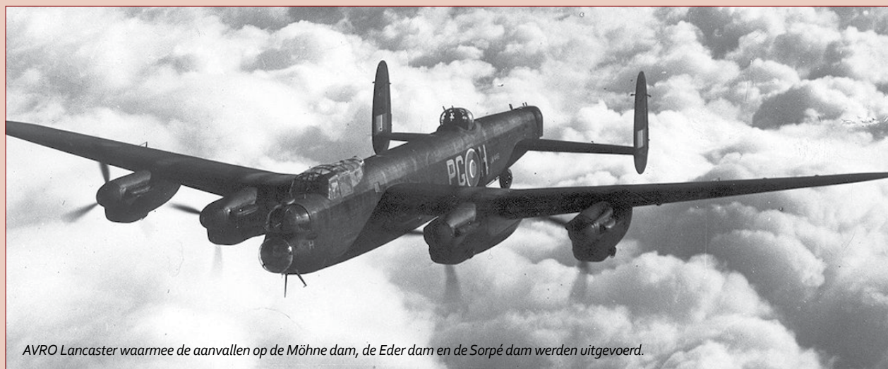
AVRO Lancaster waarmee de aanvallen op de Möhne dam, de Eder dam en de Sorpé dam werden uitgevoerd.