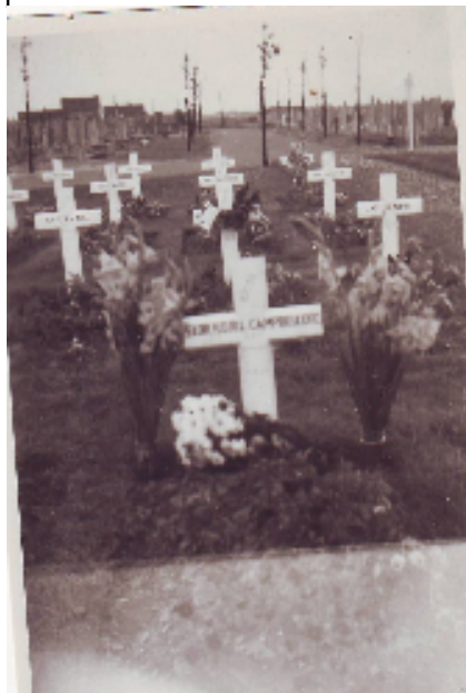
Leroy Campbell's graf kort na de oorlog