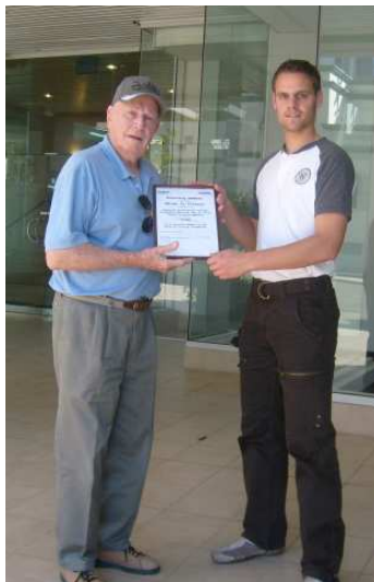
Overhandiging oorkonde "Honorary member of the Wings to Victory foundation"