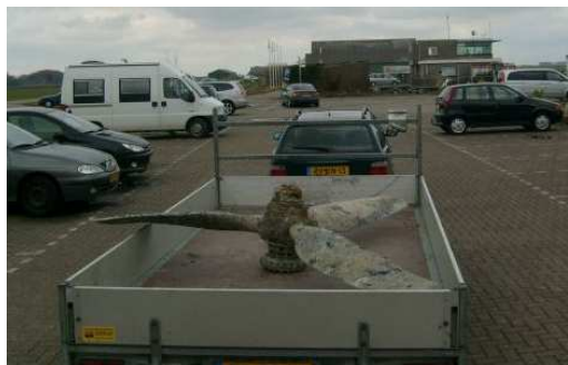
De propeller, net opgevist uit zee