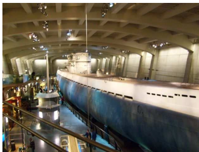
Û-505 in het Science and Industry museum, Chicago.