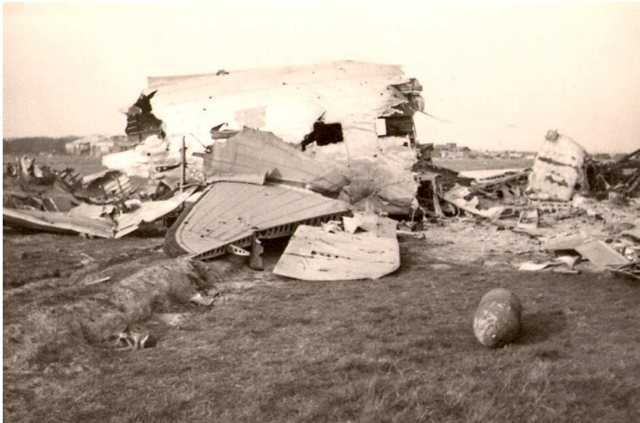
Het wrak van de C-47 op het vliegveld Haamstede.