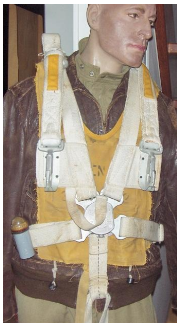
De opstelling in ons museum met de B4 onder het A4 parachuteharnas.