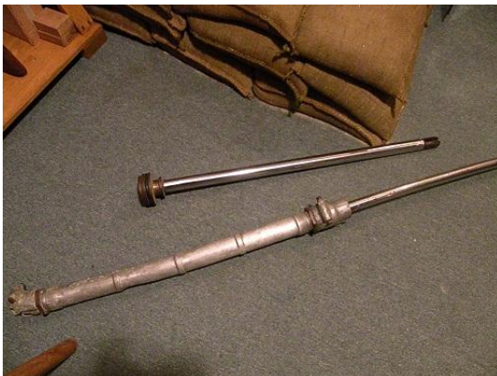
Bomdeur cilinders B24 42-50596