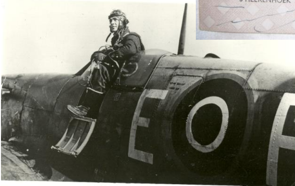
Mazurkiewicz in een Spitfire