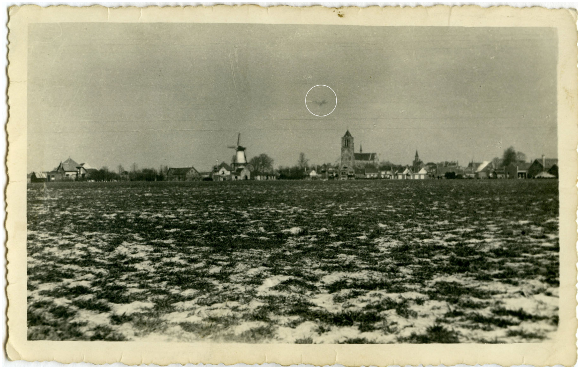
VI boven Tholen 1945.

email : leospitcon@zeelandnet.nl tel : 0111-652349