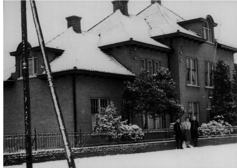
Hulst. Kazerne in de winter

Zondagochtend werd als afsluiting een stadswandeling gemaakt door Hulst onder begeleiding van een stadsgids. De weergoden hadden op beide dagen gelukkig het beste met ons voor. Zeer positief gestemd en met het idee dat een oorlog toch ook nog positieve dingen kan opleveren, ondernam het gezelschap rond de middag weer de reis naar huis.