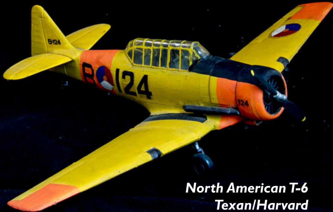
North American T-6 Texan/Harvard