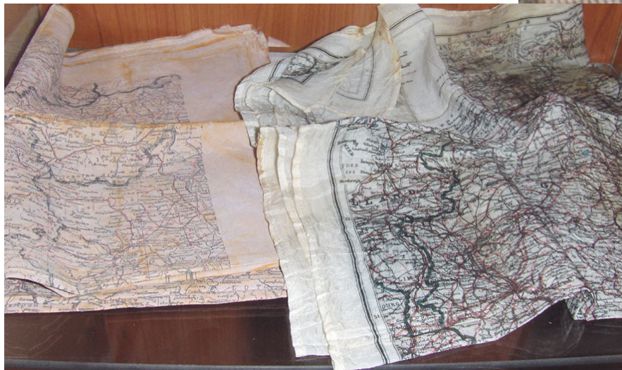
De linnen ontsnappingskaarten

De sluiting van het chuteharness, de houten stoppen en het rubberen zakje uit de "dinghy."