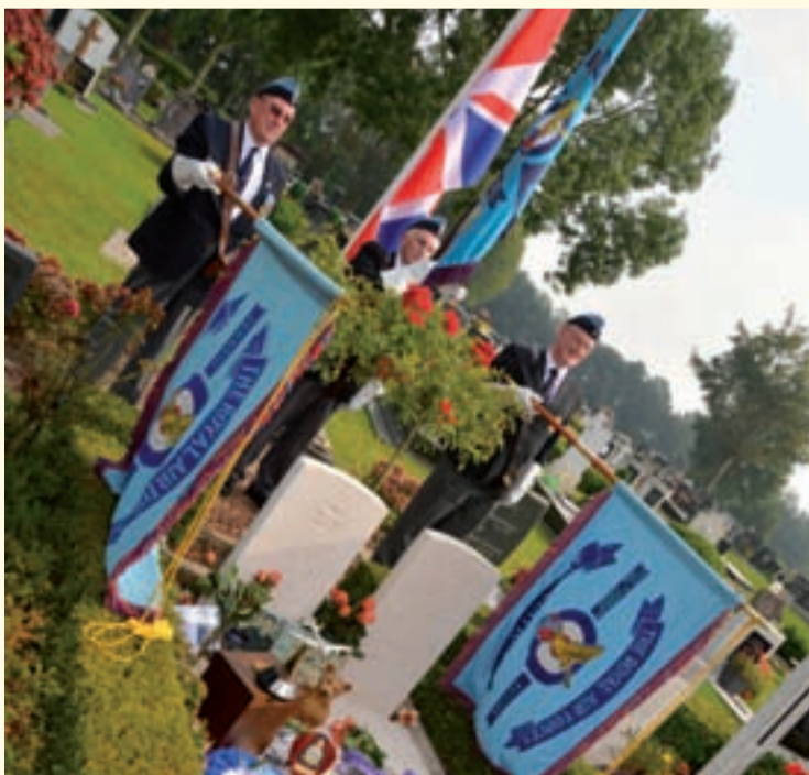
● Foto 2: Een even prachtig als indrukwekkend eerbetoon van de Royal Air Forces Association bij de met kransen en bloemen overladen graven van de oorlogshelden die in Steenbergen de dood vonden. Gibson wordt zelfs wel beschouwd als de grootste Engelse krijger ooit.