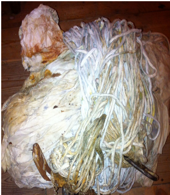
De gevonden parachute

Recent ontving Wings to Victory onderdelen van dit vliegtuig via de Koninklijke Luchtmacht. Meer dan 70 jaar hebben restanten