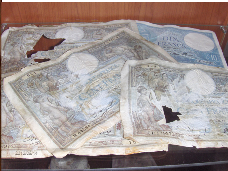
Aantal biljetten uit de "Escape Kit"

van dit vliegtuig in de Zeeuwse grond verborgen gezeten. Bijzonder is de staat van de onderdelen, maar opmerkelijker zijn de persoonlijke spullen die van dit vliegtuig teruggevonden zijn. Zo is een complete parachute gevonden. Deze moet dus van Flt Sgt Atkin of van Sgt Molloy geweest zijn. Er werd geld gevonden die in de "Escape kit" gezeten heeft. Belgische, Franse en Nederlandse biljetten.