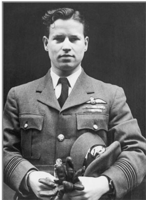
WING COMMANDER G.P. GIBSON V.C. D.S.O & BAR. D.F.C. & BAR.