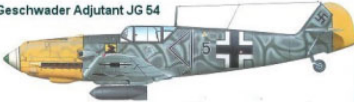
Geschwader Adjutant JG 54

Opmerking: De 5 is hier zwart en niet de staffel kleur. Dit komt doordat dit vliegtuig een fighter bomber was.